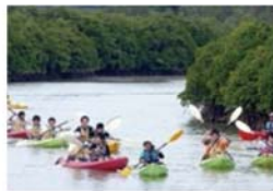
自然体験学習を通して、ワクワクを実感。動けば思いがつかえます。