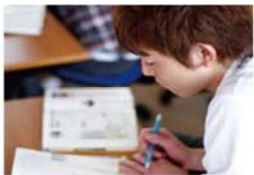
簡単な内容から始めて徐々にステップアップ。段階的個別学習で学力の定着を図ります。

LEARN × ART × NATURE = LAN 学ぶ 創作する 自然体験する