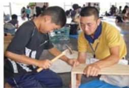
絵画・イラスト・木工など、興味のある創作に時間をかけて取り組めます。