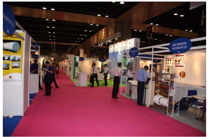
広い会場に多くのブースが設置され、ビジネスマンの商談が行われています。ビジネスが成立しなければ 出展する意味はないということです。 (日本から初めて出展されたという中小企業の社長さんは大きな手応えを感じたようです)