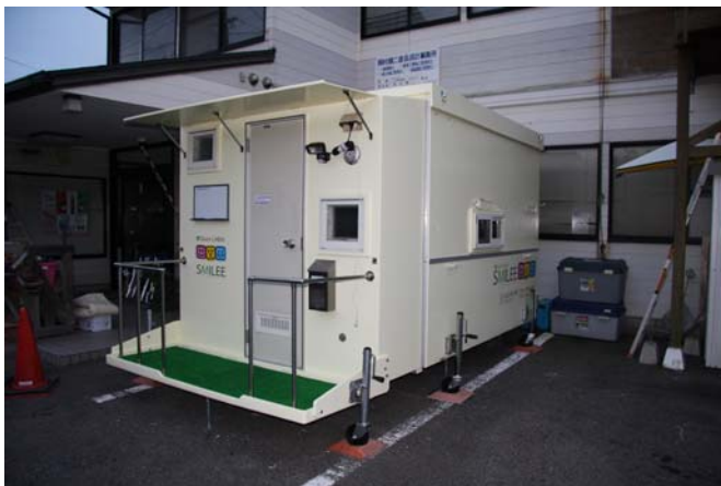
解体前の「支援ハウス」

10月4日 「支援ハウス」を解体。内部に全部材と展示用パネルなどを納めました。まだ大人2人くらい入るスペースがありました。緊急生活物資を納めるスペースが十分あります。