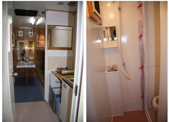
ベッドなどの備品取付けを終えた室内 テーブルには食器を飾りました。