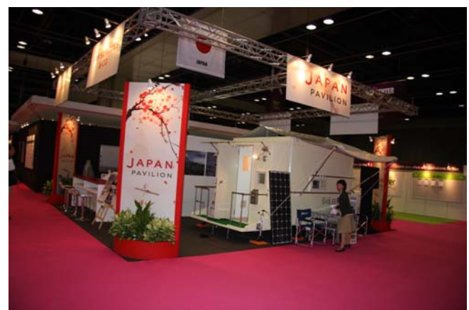
会場内の通路には、赤いジュウタンが敷き詰められ、各ブースの上には各国の国旗が吊り下げられています。ジャパンパビリオンの上にも日本の国旗、何か日本を背負って来ているような責任を感じました。