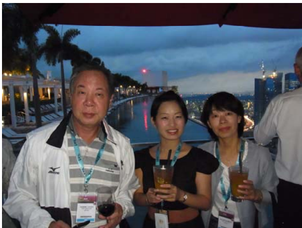
JEC主催のパーティーは、ソフトバンクのCMで有名な「マリーナ ベイ サンズ」で行われました。