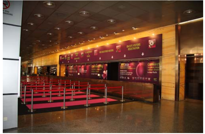
右は一階ホールの広い受付。会場は4階エスカレーターで上がります。 来場者はインド、タイ、フランス、インドネシア、ベトナムなど様々です。英語は必須ですね。