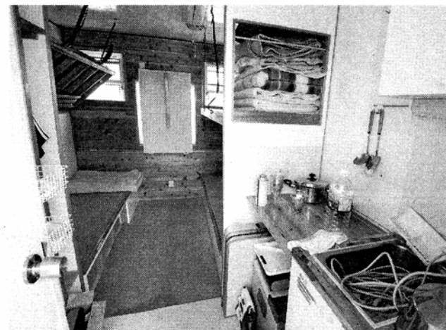
（上から）1時間で組み立て可能な「復興支援ハウス」。台所や二段ベッドなどが備えられている