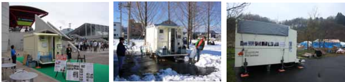
「2005 国際プラスチックフェア」 特別展示（千葉県幕張メッセ・玄関にて）