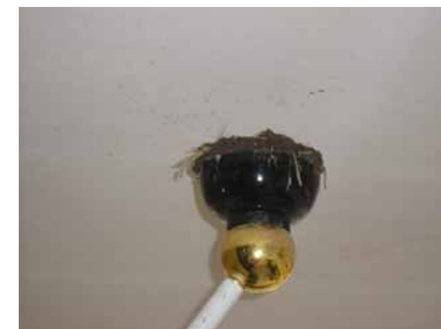
2006.5.8 お椀の上に、再度、巣づくりに挑戦