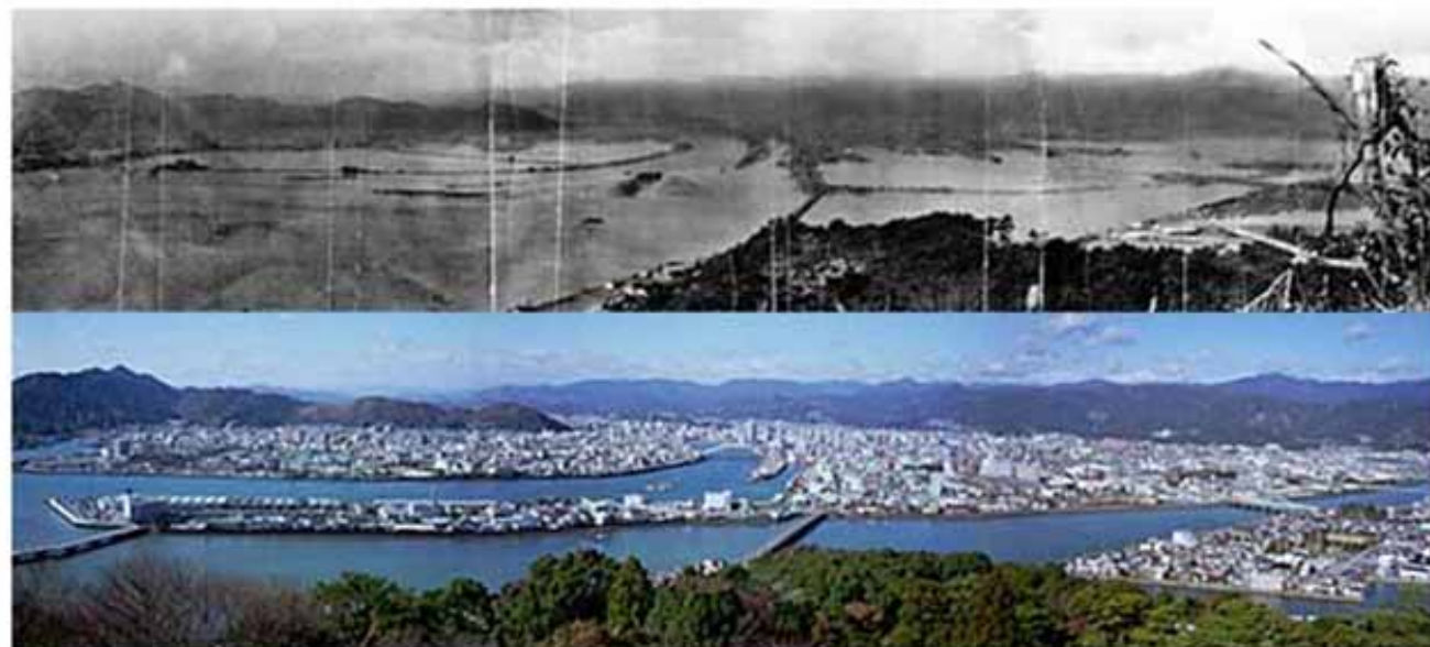
上:昭和21年南海地震後の高知市の様子 下:現在の高知市(五台山より)