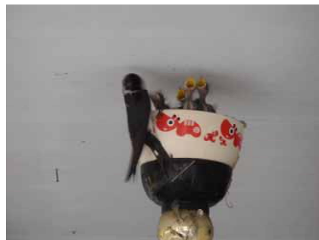
2006.5.8 井の上の巣で、子育てに励む親ツバメ