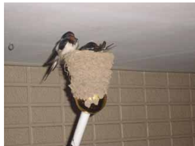
2006.5.2 卵を温めるツバメ、このあと悲劇が・・・