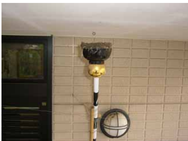
2011.7.2 完成したツバメの巣、またも悲劇が・・・