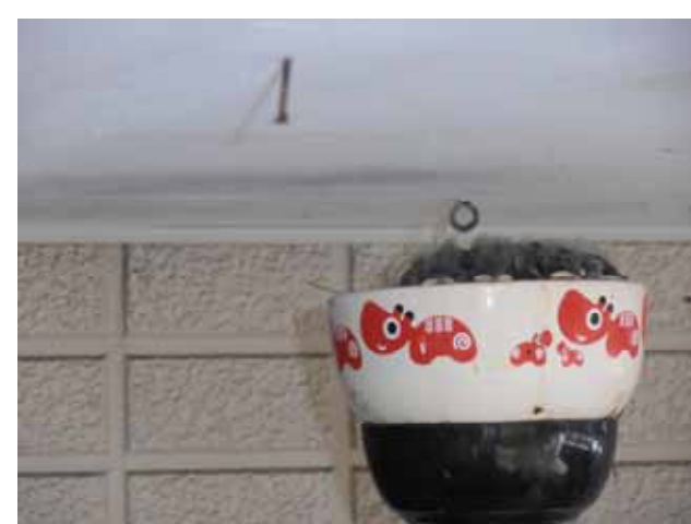
2011.7.5 巣の中で眠る5羽の雛、またも悲劇が・・・